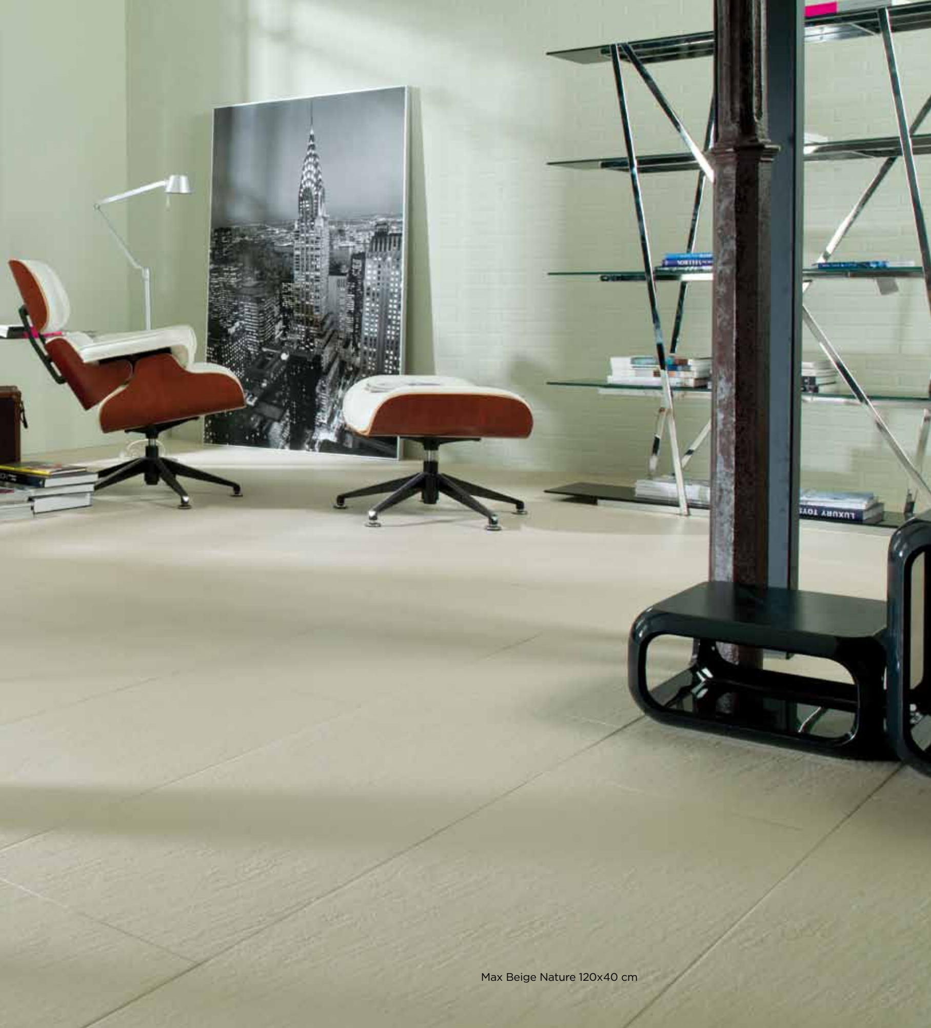
Max Beige Nature 120x40 cm