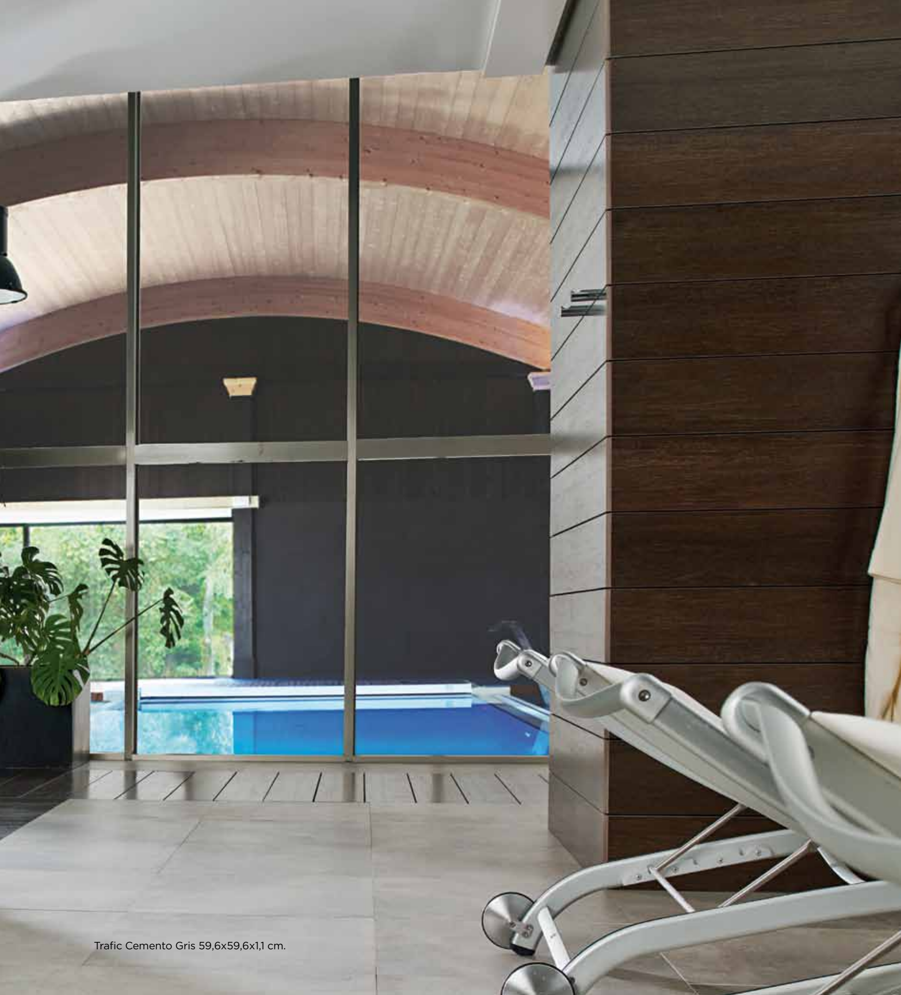
Trafic Cemento Gris 59,6x59,6x1,1 cm.