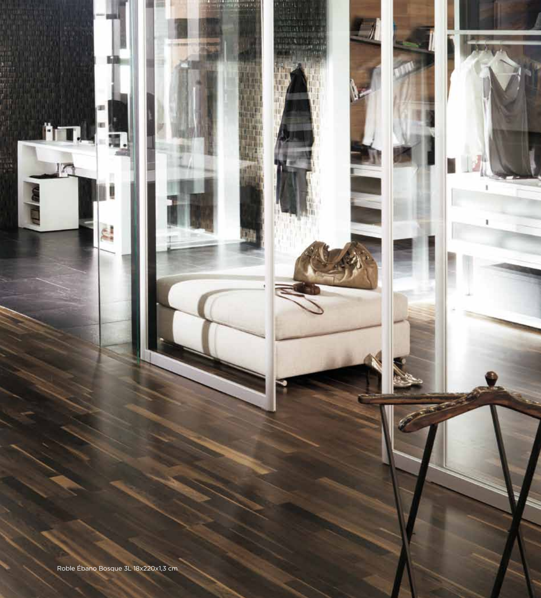
Roble Ébano Bosque 3L 18x220x1,3 cm